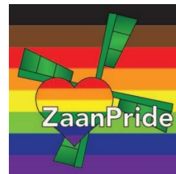
ZaanPride jaarpin 2022