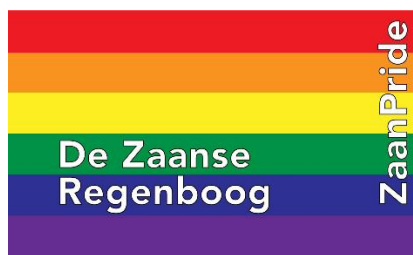
De Zaanse Regenboogvlag