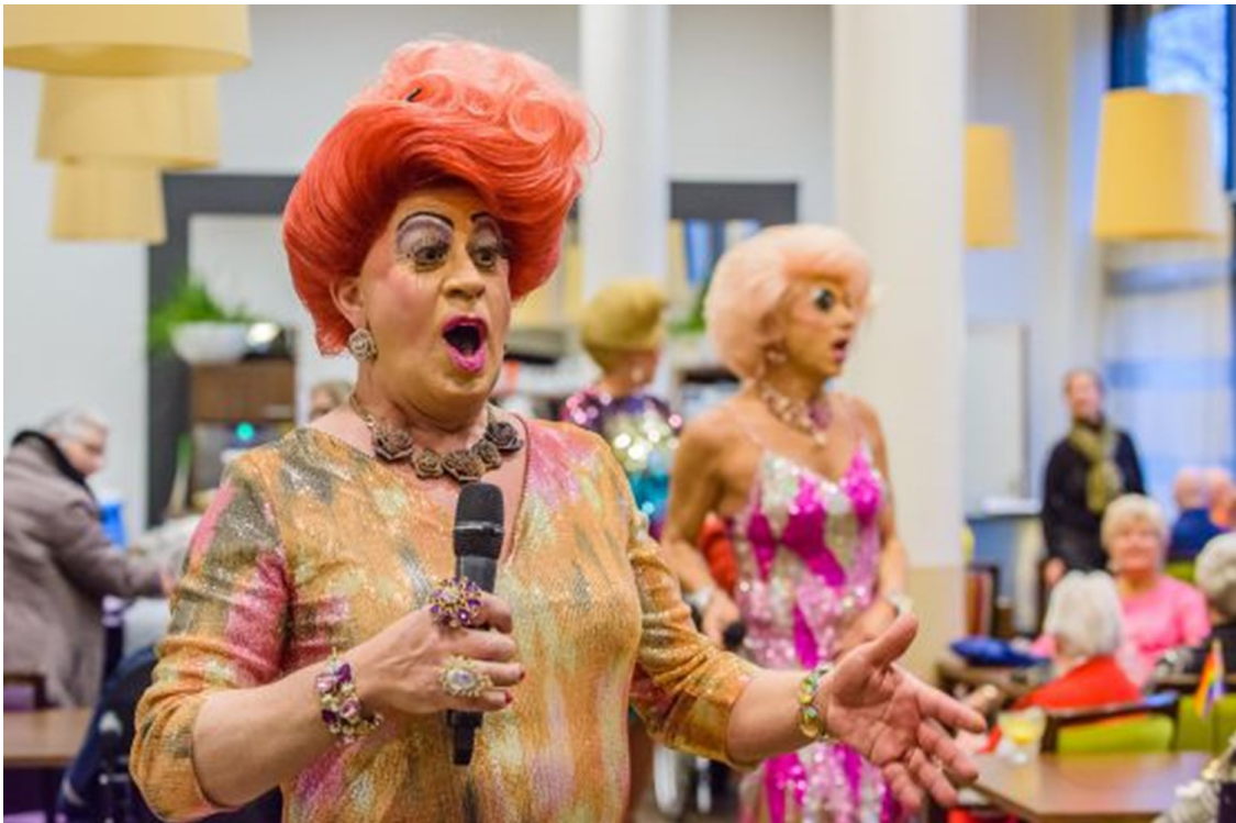
Een roze activiteit van Zorgcirkel Saenden in Zaandam.