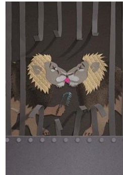
Fok me hokje