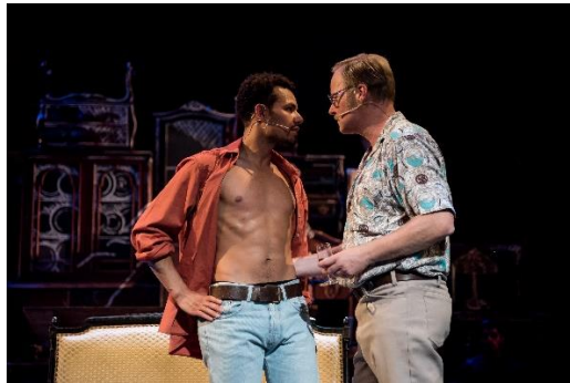
As you like it